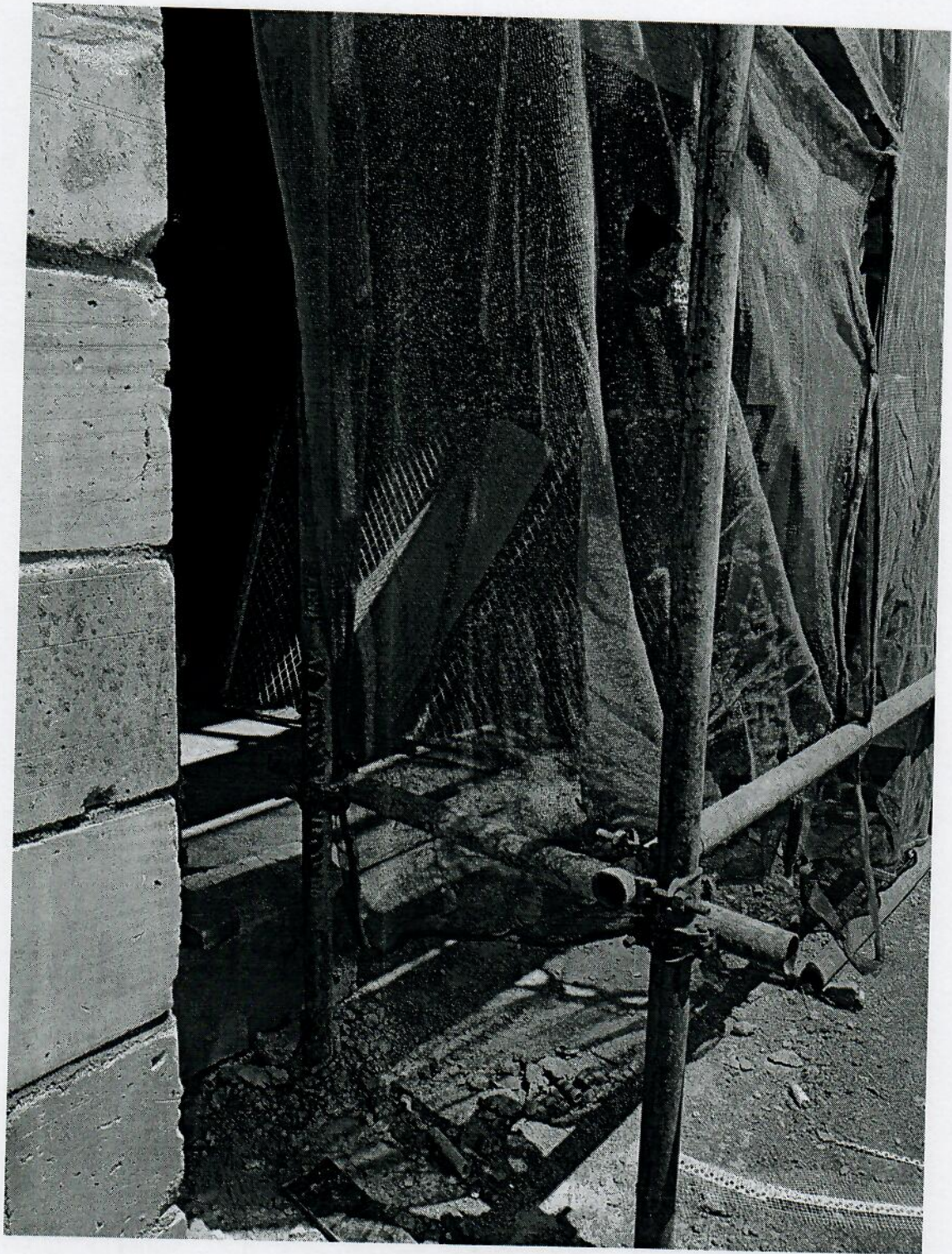
从此处垮出防护区域（外景）