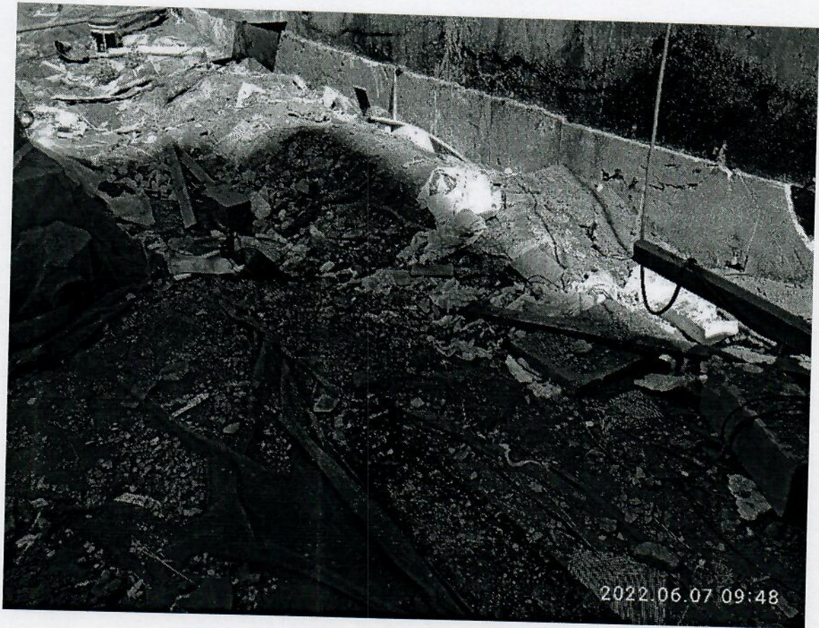
死者墜落部位情况