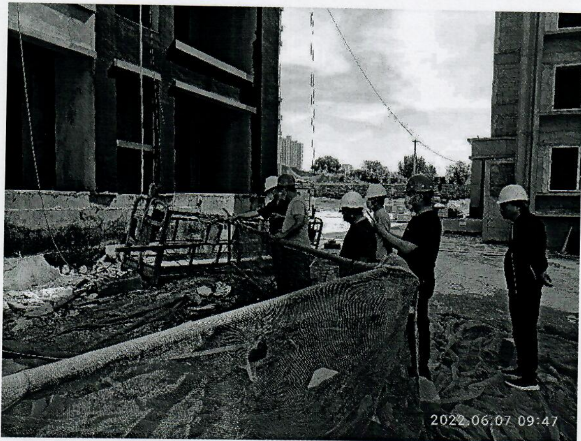
事发部位已采取防护进行了封闭

2022 年 6 月 7 日, 事故调查组成员对宝成·锦府项目“5·23”事故部位进行了勘察, 并查阅了相关安全技术及管理资料、调查记录。事故现场照片如下: