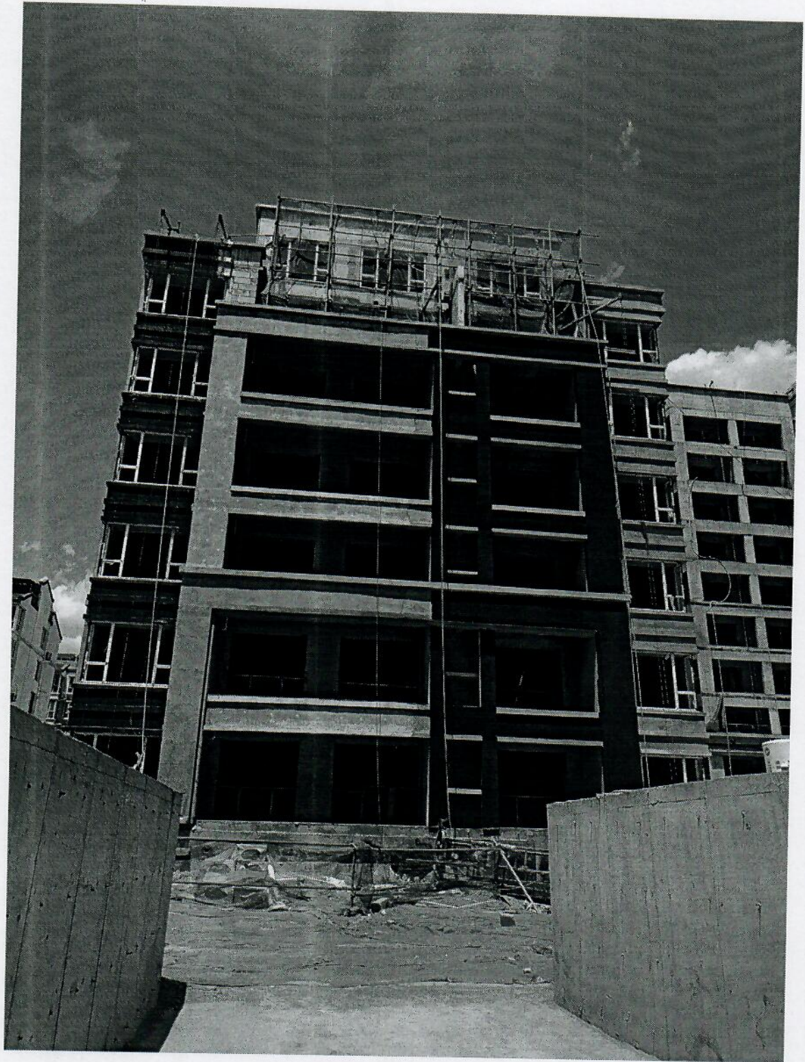
事发部位建筑物外立面情况