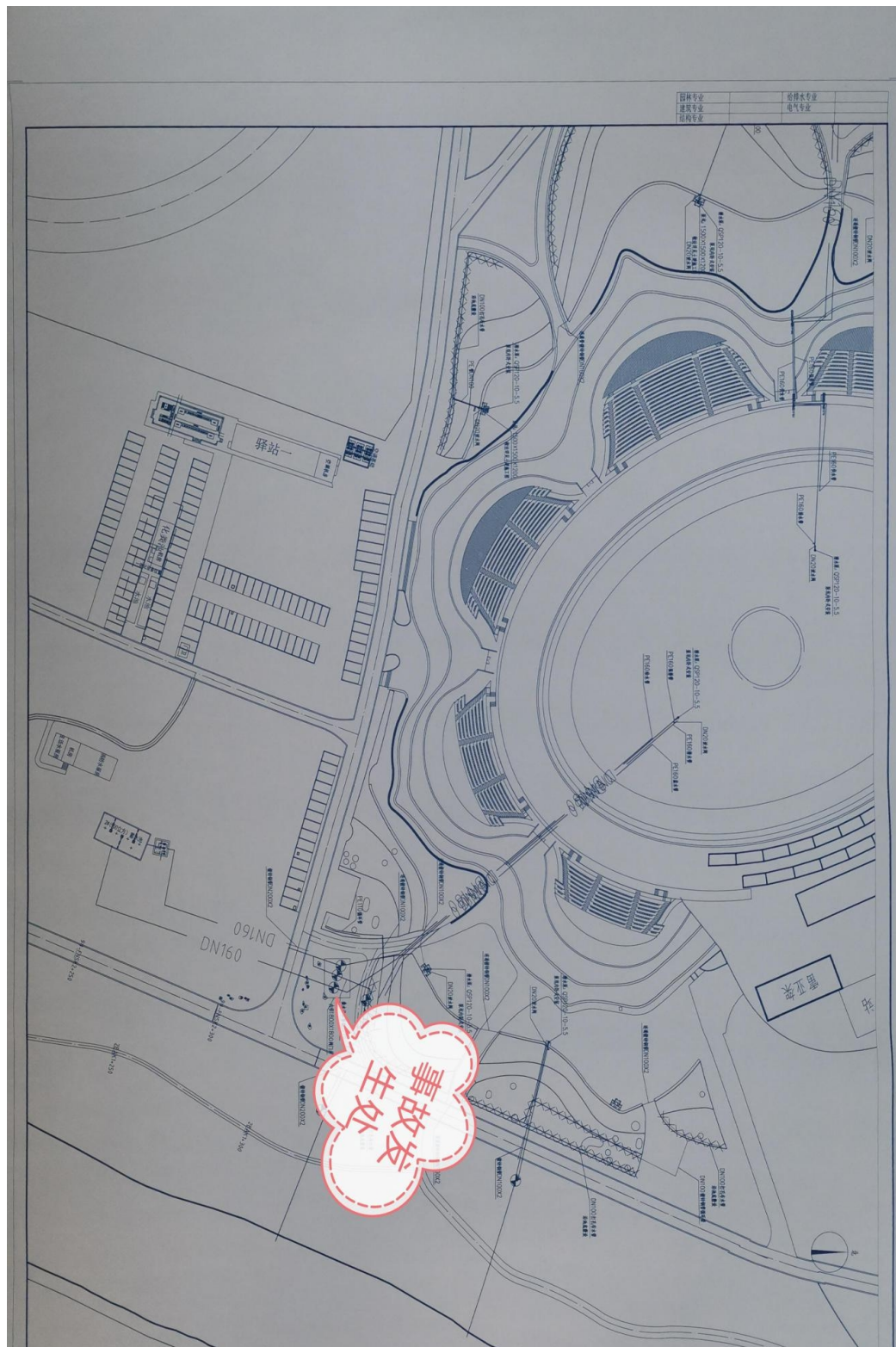
附件：2.事故处局部图