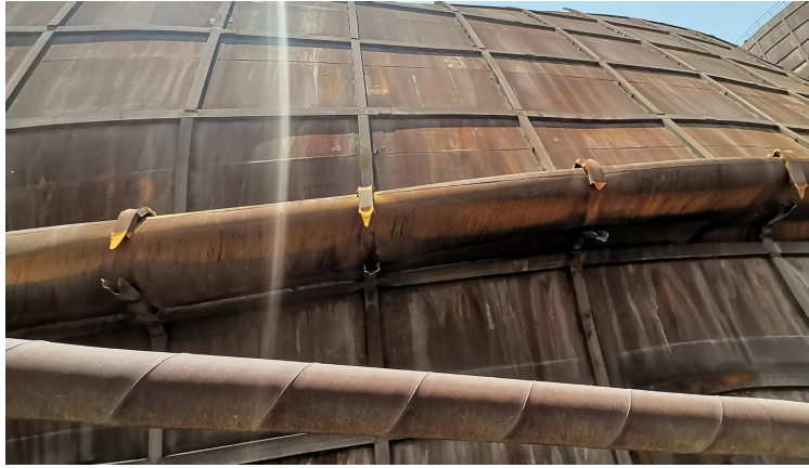
图 4 1#仓仓壁凸起损伤和被拉断的竖向筋