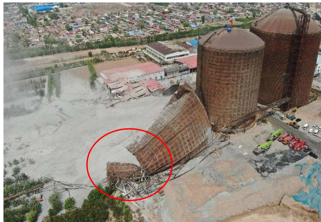
图 2 1#钢筒仓仓壁撕裂现场图