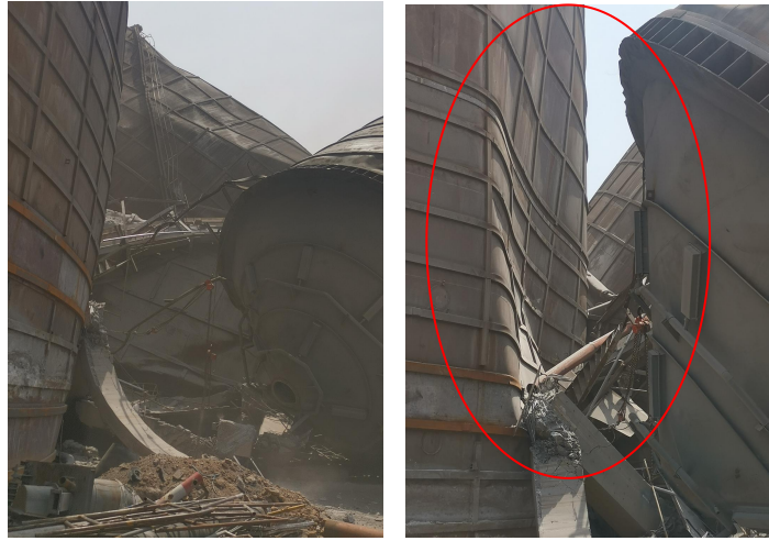
图 7 缓冲仓倾倒导致 2#钢筒仓损伤情况

经现场勘验：1#钢筒仓西北侧的仓壁钢板下有一辆装载机被埋压（见图 8），装载机驾驶室被挤压严重变形。倒塌过程中，大部分粉煤灰冲倒厂区西南侧围墙后覆盖农田，小部分粉煤灰流入西侧的生产车间。上料车间东侧基本垮塌，1/3 部分被掩埋（见图 9），车间内大部分设备、设施不同程度产生位移或被掩埋。车间西侧钢结构均发生了扭曲变形，车间安装的 10 吨单梁起重机已脱轨，一侧坠落地面，地面堆积粉煤灰厚约在 2-6m（见图 10）。其中部分粉煤灰冲毁上料车间和制砖车间的隔墙和窗户后涌入制砖车间内，导致该制砖车间部分设备被埋，制砖车间南侧区域的地面上覆盖了一层厚度约为 1-2m 的粉煤灰（见图 11）。