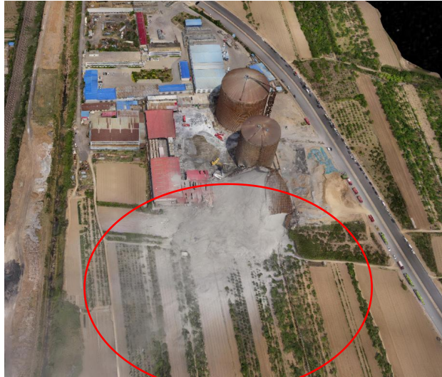
图 1 1#钢筒仓坍塌现场全景图