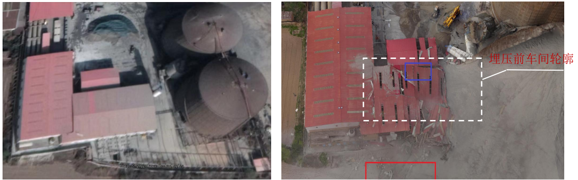
图 9 上料车间事故前后对比