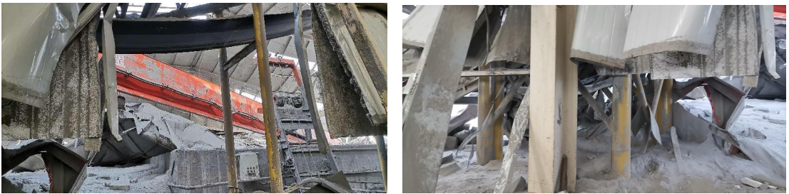
图 10 上料车间内破坏情况