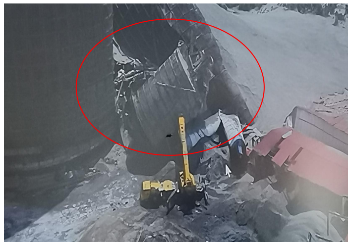
图 6 缓冲仓倾倒状态