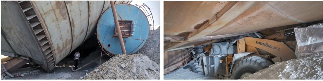
图 8 缓冲仓倾倒处装载机埋压情况