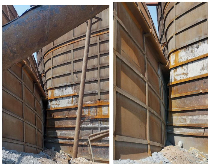
图 3 1#仓倒塌导致 2#仓仓壁损伤情况