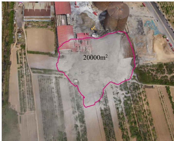
图 5 粉煤灰流出面积